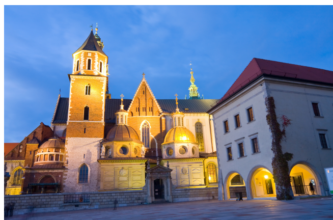
Cracovia, Castello Reale