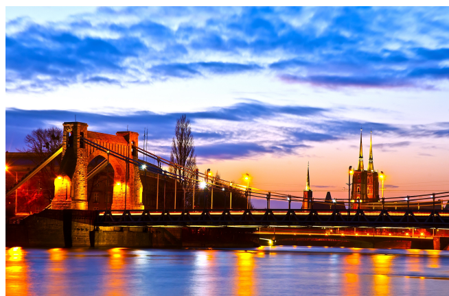
Panorama di Breslavia