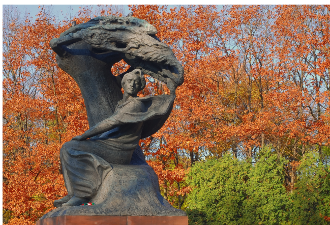
Varsavia, Parco Lazienkowski Monumento a Federico Chopin

7 giorno Cracovia – Italia mattina La prima colazione in albergo. Check-out dall'albergo. xx Trasferimento all'aeroporto di Cracovia e partenza da Cracovia e dalla Polonia.